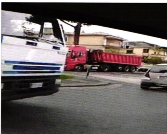
Figura 2- camion alla rotonda di via Libertà

Centinaia di TIR attraversano ogni giorno il nostro comune inquinando l'aria e creando traffico.