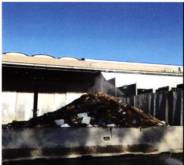
Figura 1 - rifiuti pericolosi nel sito

Una delle priorità sarà la salute pubblica e la cura dell'ambiente, in tale ottica procederemo all'immediata chiusura del sito di rifiuti pericolosi di Via Figliola con relativa discarica.